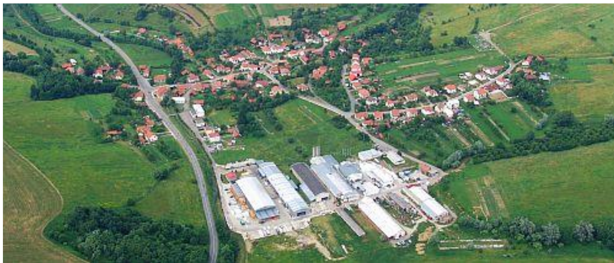
Obr. 1 Letecký snímek Kaňovic