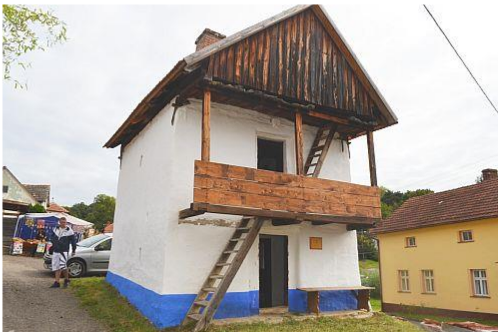
Obr. 7 Sýpka v roce 2009