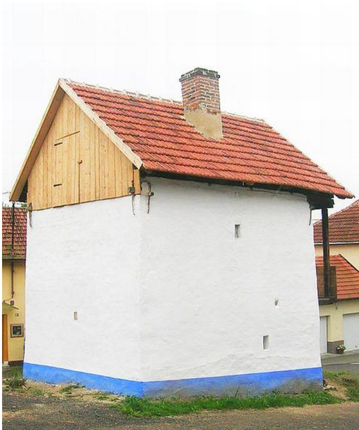
Obr. 6 Sýpka v roce 2009