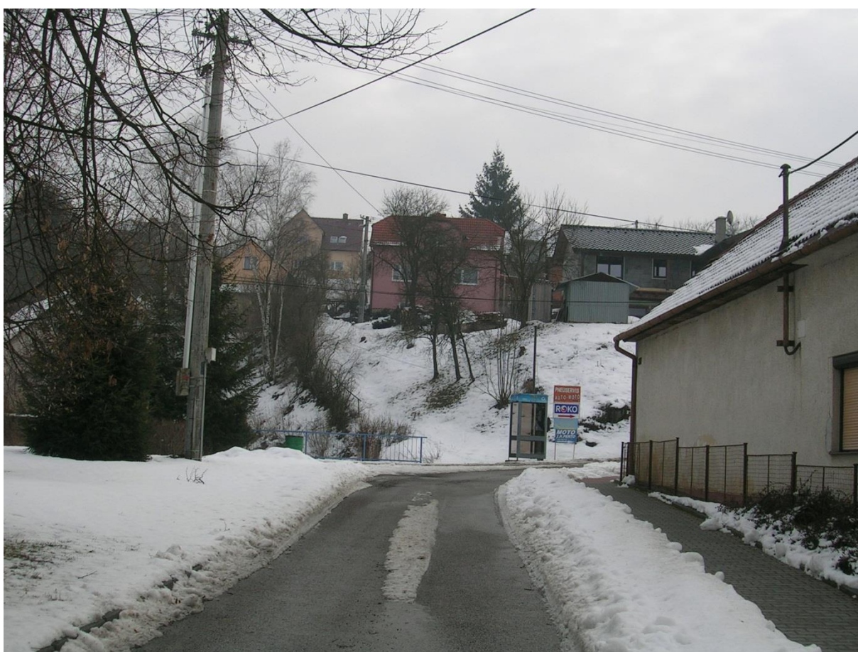
Obr. 14 Stejný pohled z roku 2013