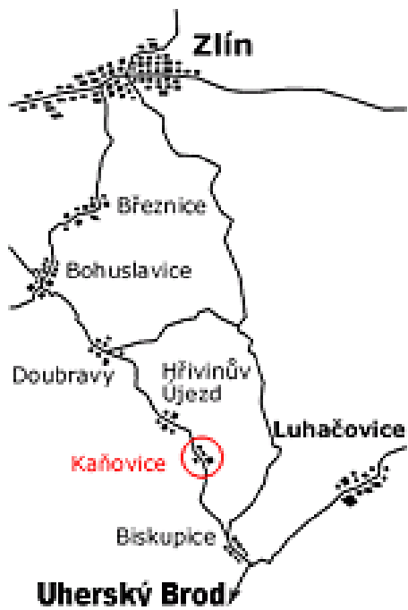
Obr. 16 Poloha Kaňovic