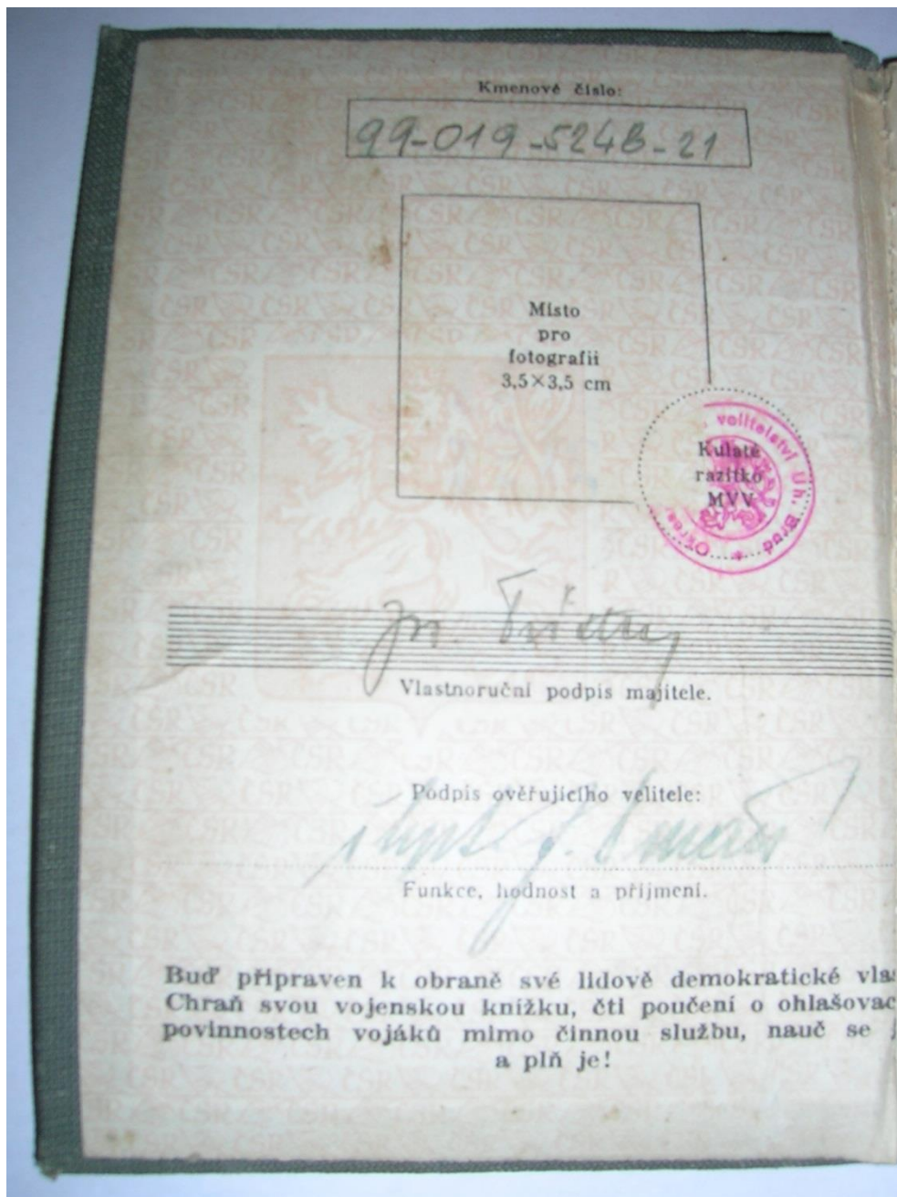
Obr. 9 Úvodní strana vojenské knížky J. Šustka. Můžeme na ní vidět podpis majitele