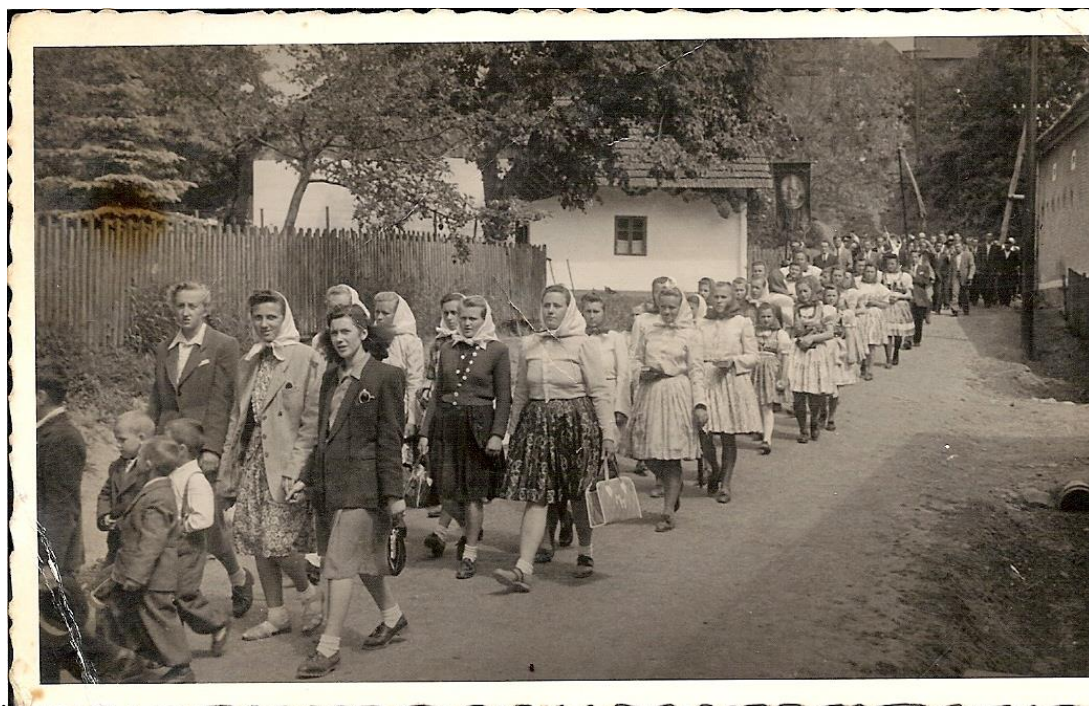
Obr. 13 Průvod z Provodova. Po pravé straně lze vidět kousek domu č.p. 31. Fotografie pochází z 50. let