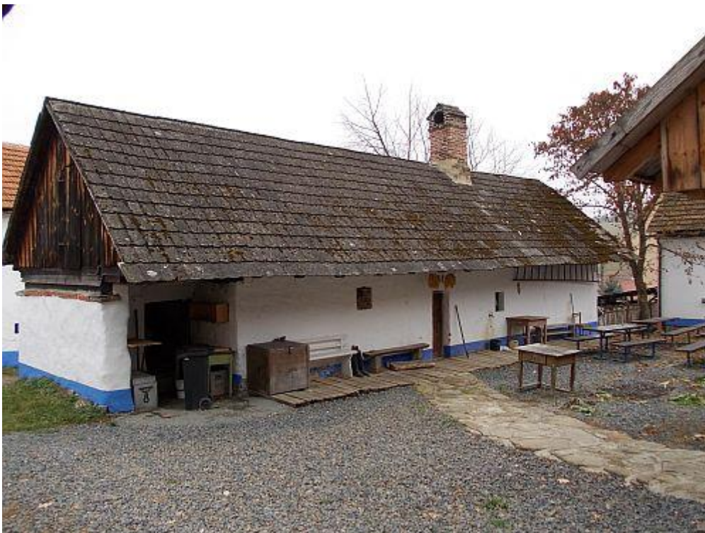
Obr. 4 Usedlost č.p. 19 ze dvora v roce 2011