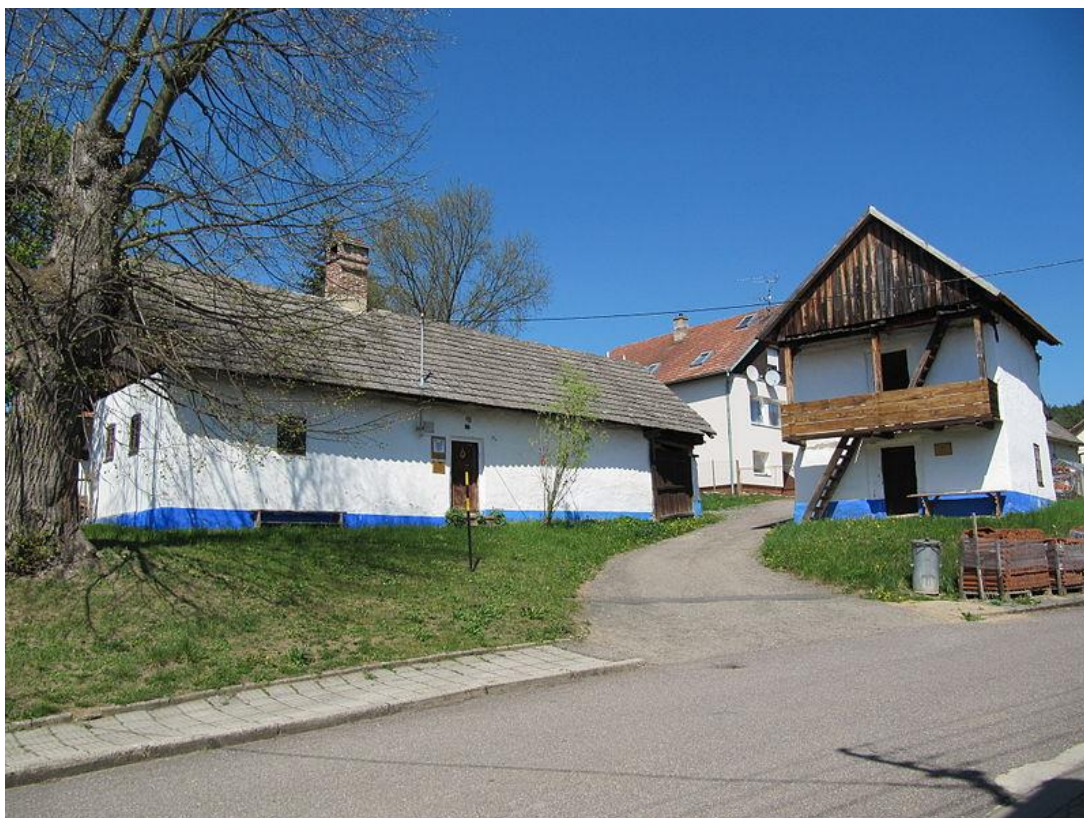
Obr. 2 Památkově chráněná usedlost č.p. 19 s komorou s pavlačí