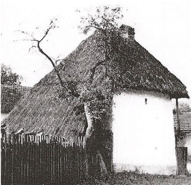
Obr. 5 Sýpka v roce 1943