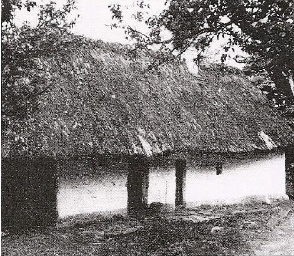
Obr. 3 Usedlost č.p. 19 ze dvora v roce 1943